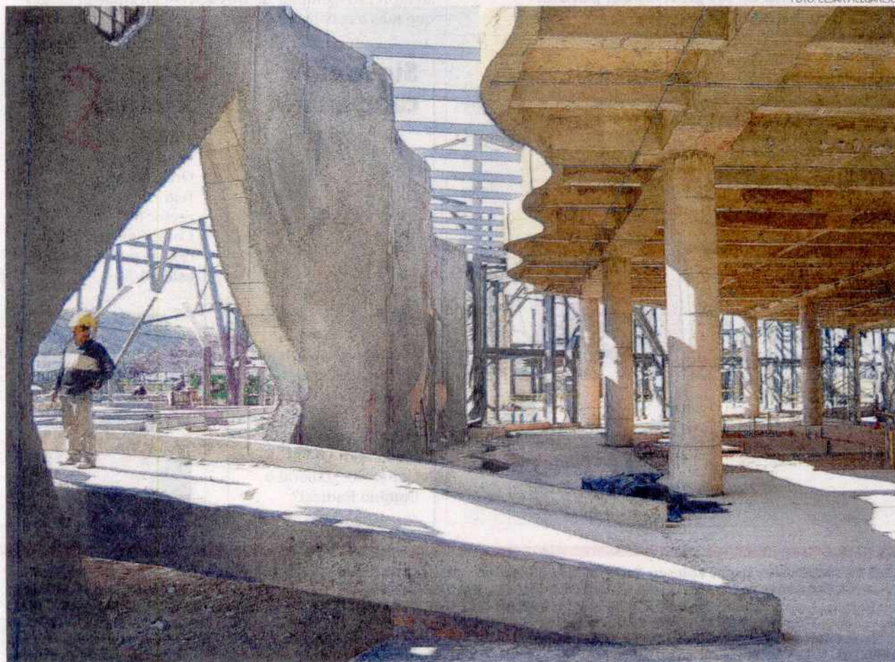
Las obras en la nueva terminal de Tunja han avanzado en un 57 por ciento; pero ya se ejecutó el 73 por ciento de los recursos que existían.