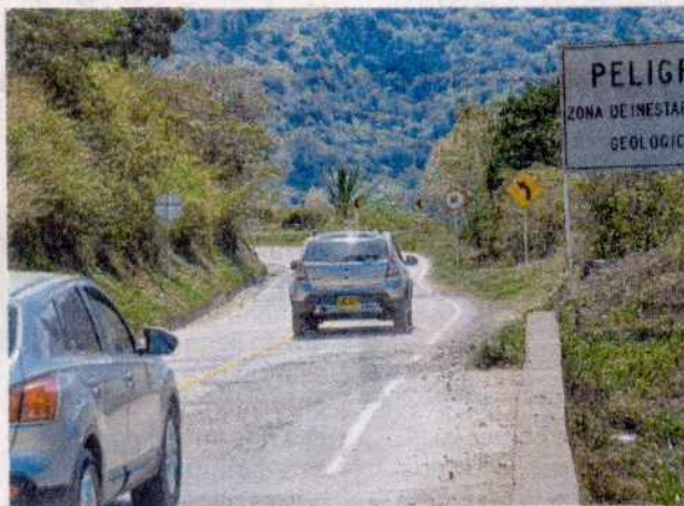
Los trabajos entre Santa María-San Luis-Aguaclara iniciarían en marzo. Guateque-Macanal y Macanal-Santa María, se iniciarían en junio.

“La fase de construcción arrancó el 31 de octubre de 2016 y desde entonces hemos venido adelantando obras, paralelamente a las actividades preliminares de esta etapa, consistentes en el replanteo topográfico, el establecimiento de sitios de disposición de escombros, al igual que de acopio de materiales, entre otros”, comentó Carvajal.