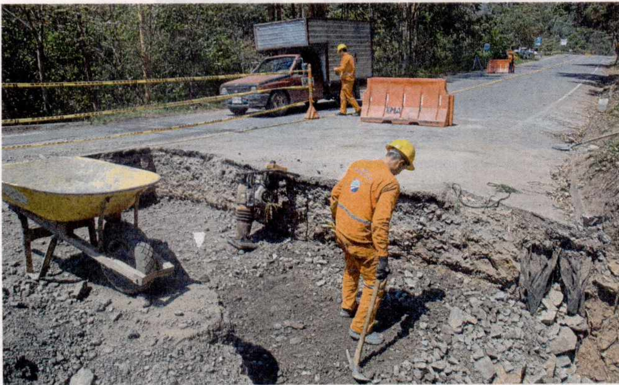
Dice la empresa concesionaria que la unidad funcional Uno, que abarca desde El Sisga (Chocontá) hasta Guateque (49 kilómetros), ya comenzó.

estas poblaciones, además de la implementación de notorias señales de tránsito. También se contempla la construcción de cuatro puentes peatonales.